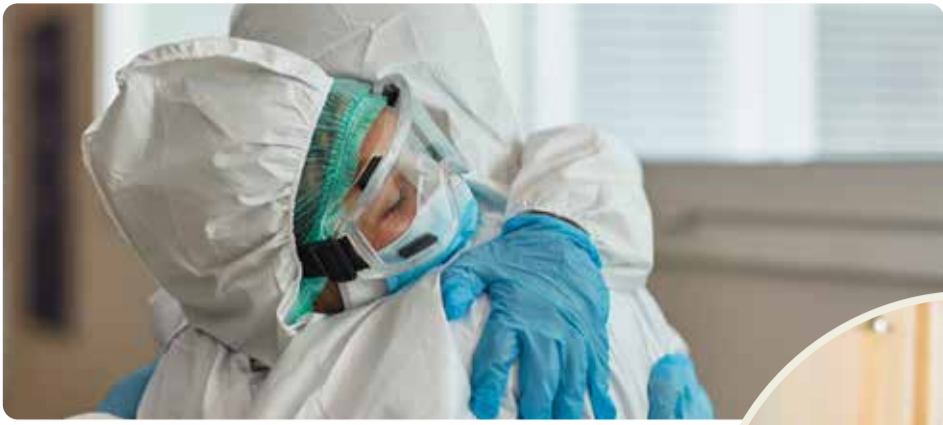
Pandemin visade på bristerna i välfärden. Vänsterpartiet vill bygga samhället starkt igen.

att välfärden ska bli sämre hela tiden, det beror helt på politiska beslut. Vi måste ta tillbaka kontrollen över skola, vård, omsorg och infrastruktur. Det fungerar inte att ge mindre och mindre pengar till verksamheter som dessutom ska ge en allt större andel av de pengarna till privata bolagsvinster. Det har slagit sönder välfärden och skapat otrygghet.