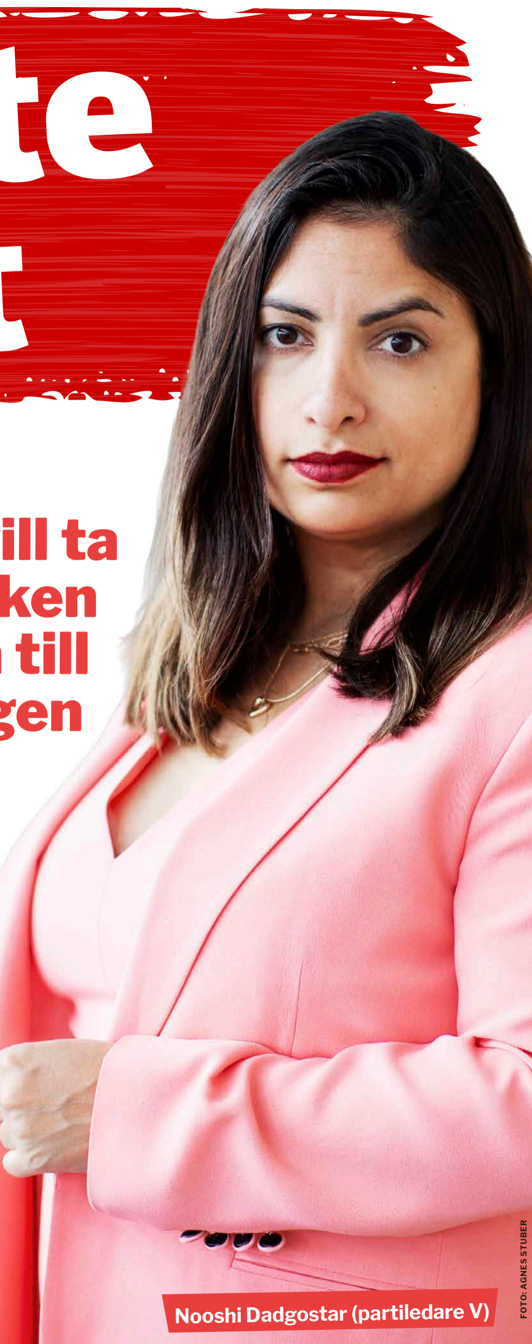
Nooshi Dadgostar (partiledare V)