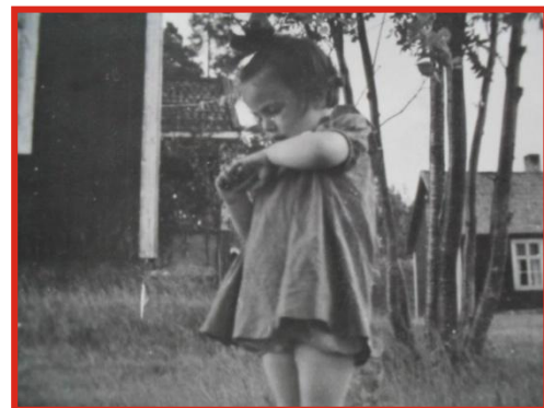
En yngre version